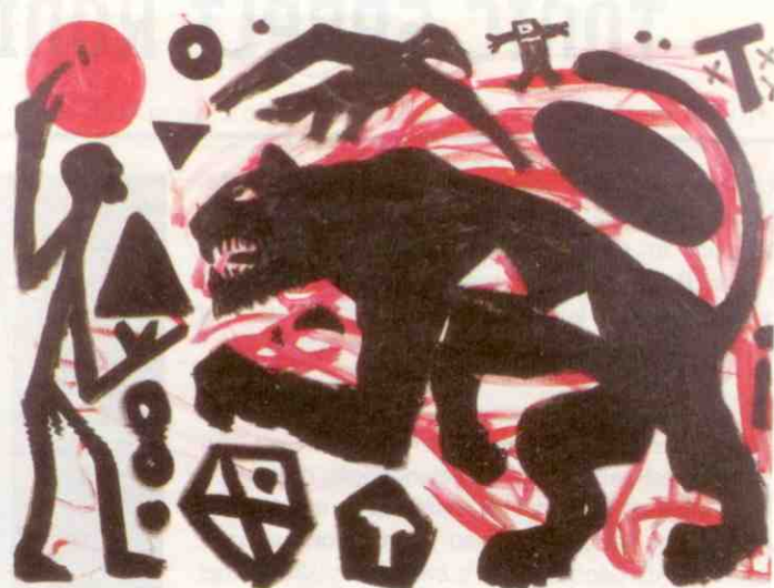
A.R. PENCK. 'Mars, Mann, schwarzer Löwe', olie op doek, 2000.

De zee bij Kiefer is het dramatische decor van alle oorlogen. Toegetakelde loden vliegtuigjes zijn als dode vlinders op het doek geprikt. Wie waren deze helden, uitgerukt om het luchtruim te veroveren en gedoemd om reddeloos te worden neergehaald? 'Une même vague de ce monde depuis Troie roule sa hanche jusqu'à nous' staat op een van de doeken geschreven. Van Troje tot Belgrado en Bagdad, dezelfde waanzin rolt zich als een golf over ons uit, door vele eeuwen heen. De tot fossiele stratificaties herschapen zee houdt alle sporen van de menselijke vernietigingsdrift vast en laat zich lezen als een historische landkaart van het lijden. Daarin doen deze geweldige doeken denken aan Kiefers landschapsschilderijen op het thema van de 'Verbrande Aarde', waarin de gruwel van de oorlog in de Duitse bodem gedrongen is, en er niet meer uit te